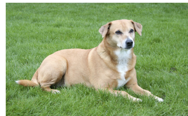
Udseendet hos den østrigske pinscher varierer en del, både hvad pels, farver og bygning angår.

Som udgangspunkt bryder den østrigske pinscher sig ikke om fremmede, men det er individuelt, hvordan den reagerer over for dem. Som fremmed er det bedst bare at ignorere den østrigske pinscher og lade den komme til dig. Den gennemskuer hurtigt de signaler, man sender, og derfor er det lettere for nogle at