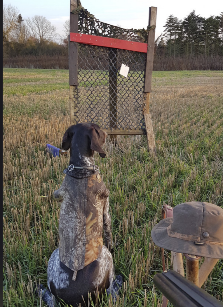
Den korthårede hønsehund er først og fremmest en jagthund, men med motion og mental stimulering ved jagtrelateret træning, får man også en god familiehund.