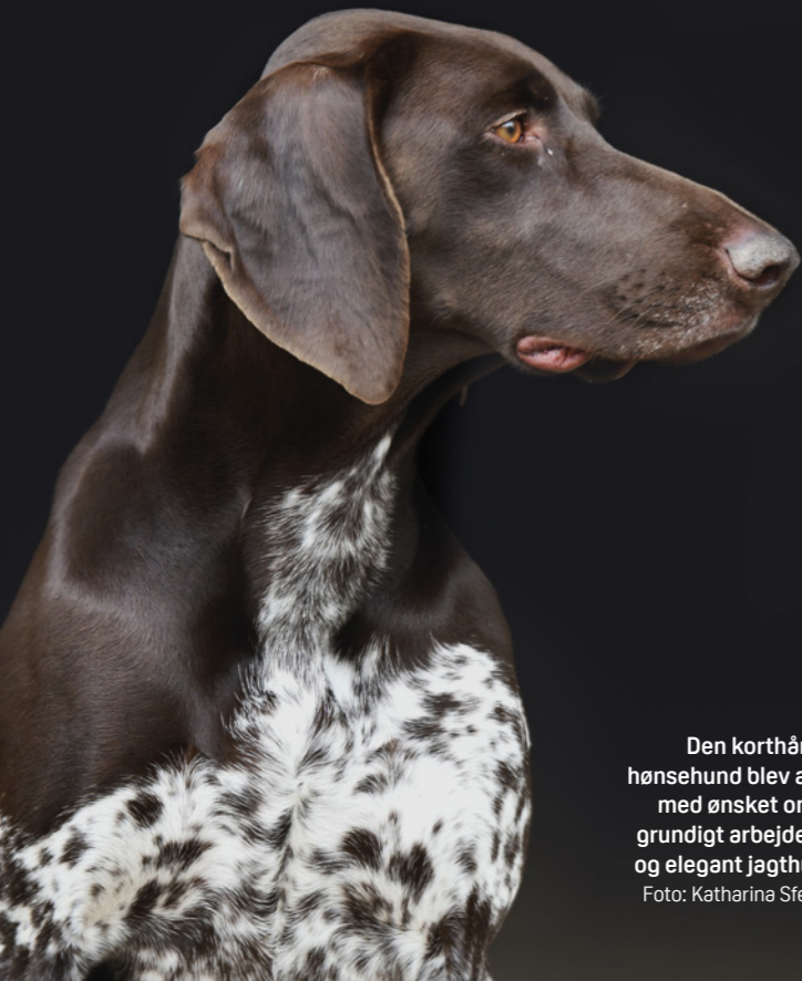
Den korthårede hønsehund blev avlet med ønsket om en grundigt arbejdende og elegant jagthund.