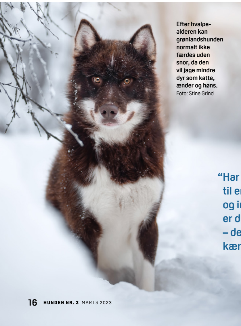
Efter hvalpealderen kan grønlandshunden normalt ikke færdes uden snor, da den vil jage mindre dyr som katte, ænder og høns.