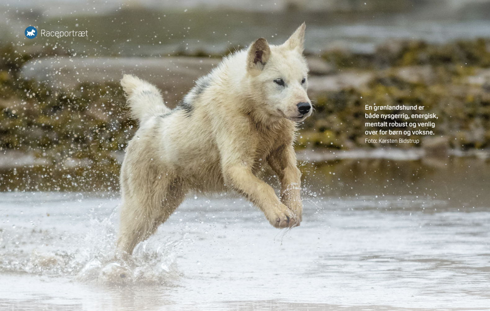
En grønlandshund er både nysgerrig, energisk, mentalt robust og venlig over for børn og voksne.

G rønlandshunden er en af Danmarks nationale hunderacer og udmærker sig som en af verdens ældste hunderacer. Grønlandshunden har igennem mere end 4000 år været tæt forbundet med inuitkulturen i Arktis og er bygget til hårdt arbejde under arktiske forhold. Racens mest fremtrædende karakteregenskaber er energi, mental styrke og uforfærdethed. Det er en passioneret og utrættelig trækhund, som overfor mennesker optræder venligt og godmodigt. Den knytter sig ikke nødvendigvis tæt til et bestemt menneske og trives bedst i en flok og med et aktivt hundeliv.