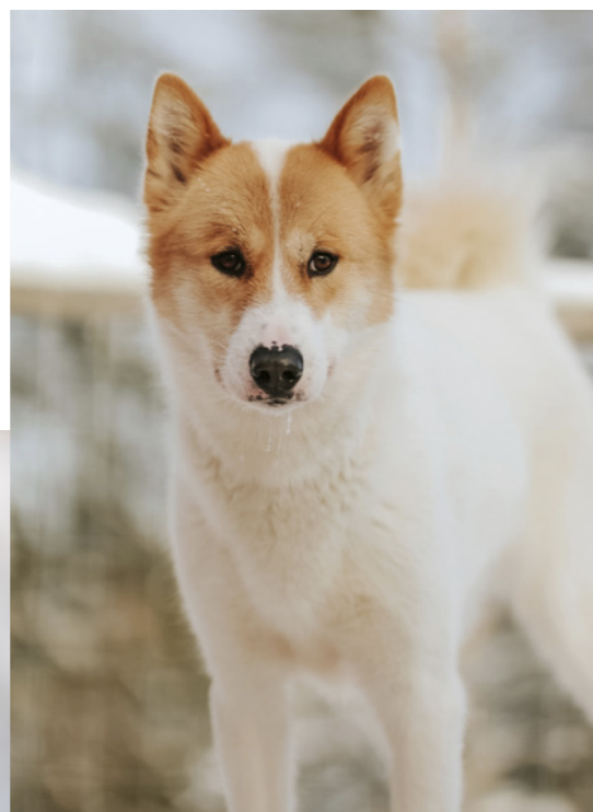
Selvom grønlandshunden kan være en smule skarp, så er det også en hund med en fantastisk personlighed.

Motion er en vigtig del af en grønlandshunds liv, og det er afgørende for en velfungerende hund, at den bliver motioneret hver eneste dag. Sæt et niveau for motionen, som du kan overholde, og tilpas din hverdag til at kunne rumme en aktiv hund. Motionen må gerne variere. Skift f.eks. mellem lange gåture, løb, cykelture, vandreture og kørsel med vogn eller slæde, hvis der er sne nok. Det er en race, som elsker at være med på tur og derfor er ideel til et aktivt friluftsliv. Lange vandre-, ski- og slædeture i fjeldet og overnatning under åben himmel er noget af det bedste, du kan tilbyde en grønlandshund.