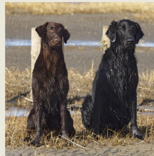
En flat coated retriever kan enten være sort eller som her leverfarvet.