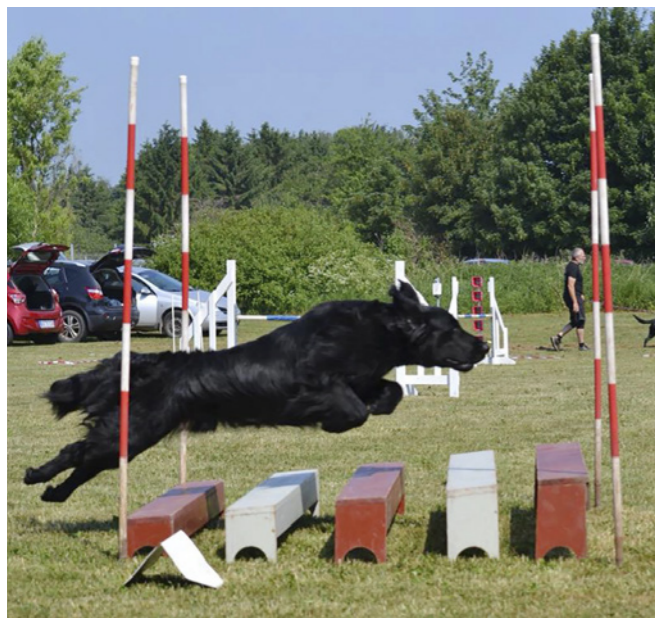
Også på agilitybanerne kan racen gøre sig gældende.