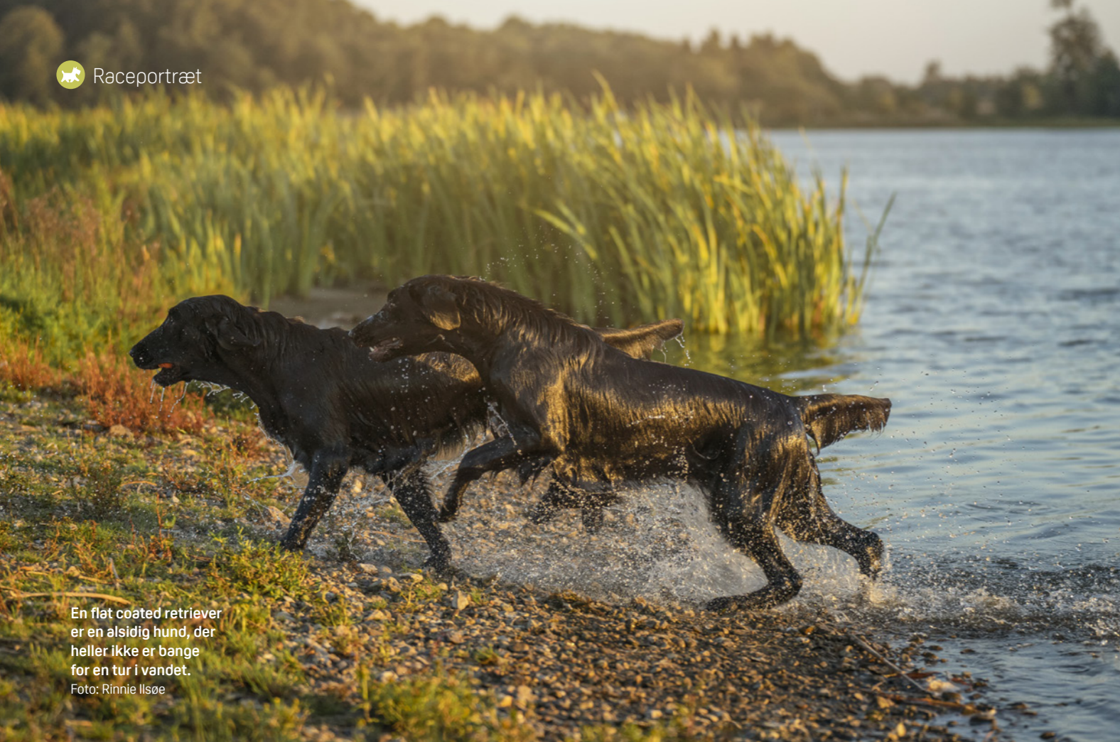
En flat coated retriever er en alsidig hund, der heller ikke er bange for en tur i vandet.