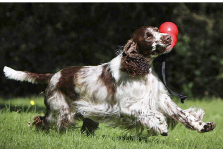
Springeren er en aktiv hund, der kan trives med mange forskellige slags aktiviteter.

rundt om sin fører/skytte. Typisk arbejder springeren i et systematisk mønster, hvor næsen og lugtesansen er dens vigtigste redskab. Netop grundet racens eminente næsarbejde bruges springeren også til at finde beskadiget vildt.