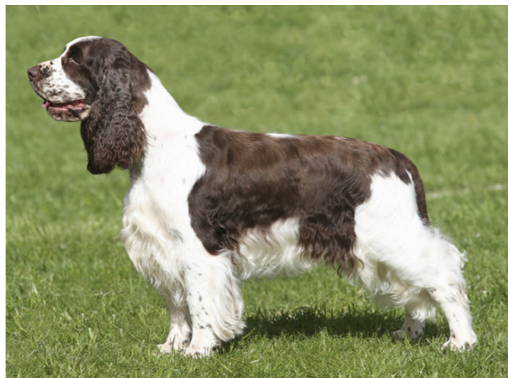
Den engelske springer spaniel er harmonisk bygget, kompakt, stærk, munter og aktiv. Det er den mest højbenede af alle de engelske landspaniels.