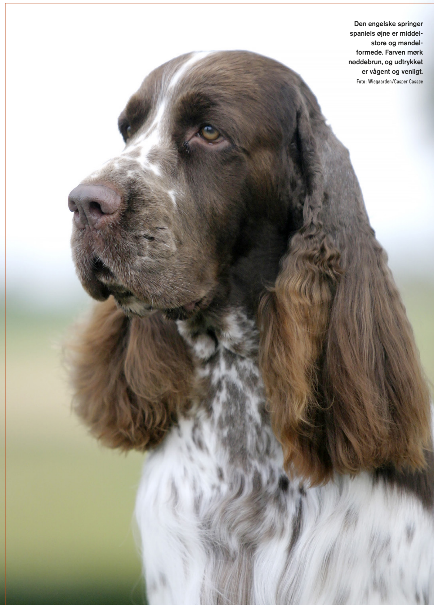
Den engelske springer spaniels øjne er middelstore og mandelformede. Farven mørk nøddebrun, og udtrykket er vågent og venligt.

Springeren er lavet til at støde og respektere vildtet. Oftest vil springeren søge i terrænet og arbejde søgende i et omfang >>>