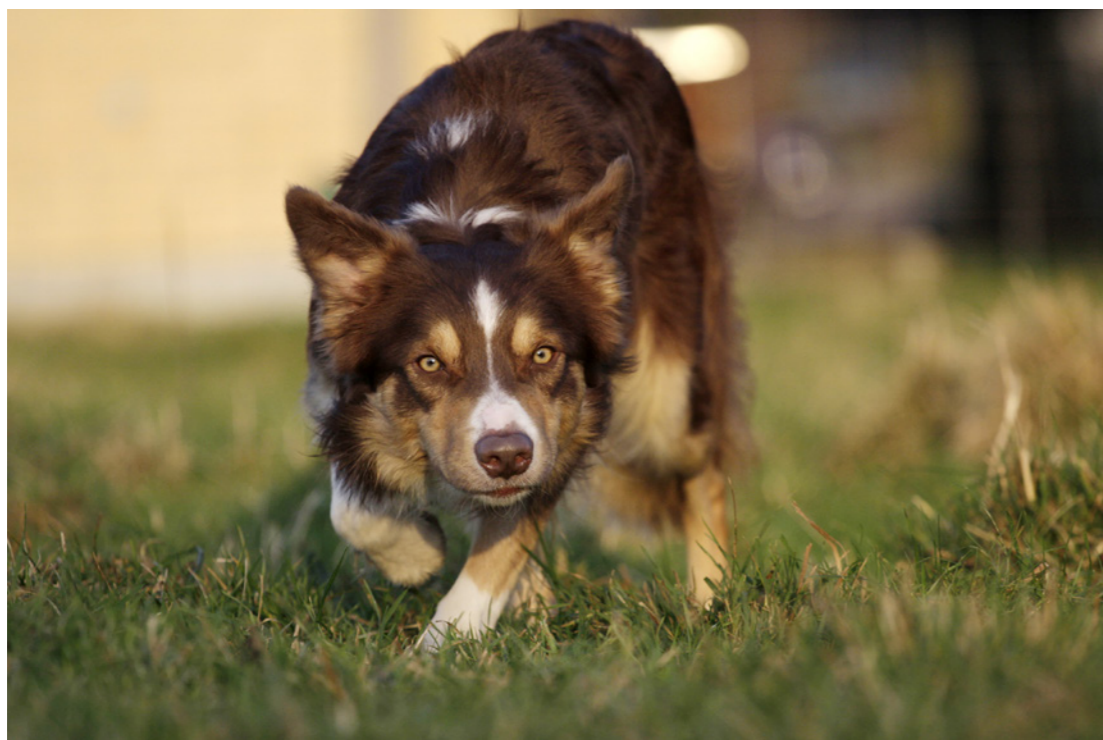
En border collie kan flytte 100 får med et enkelt blik.

ikke en vagthund. Langt de færreste border collier egner sig som vagthunde. De vil give sig til at gø, når der kommer fremmede, men så stopper det som regel der. Den er meget social og elsker at have hele sin flok omkring sig.