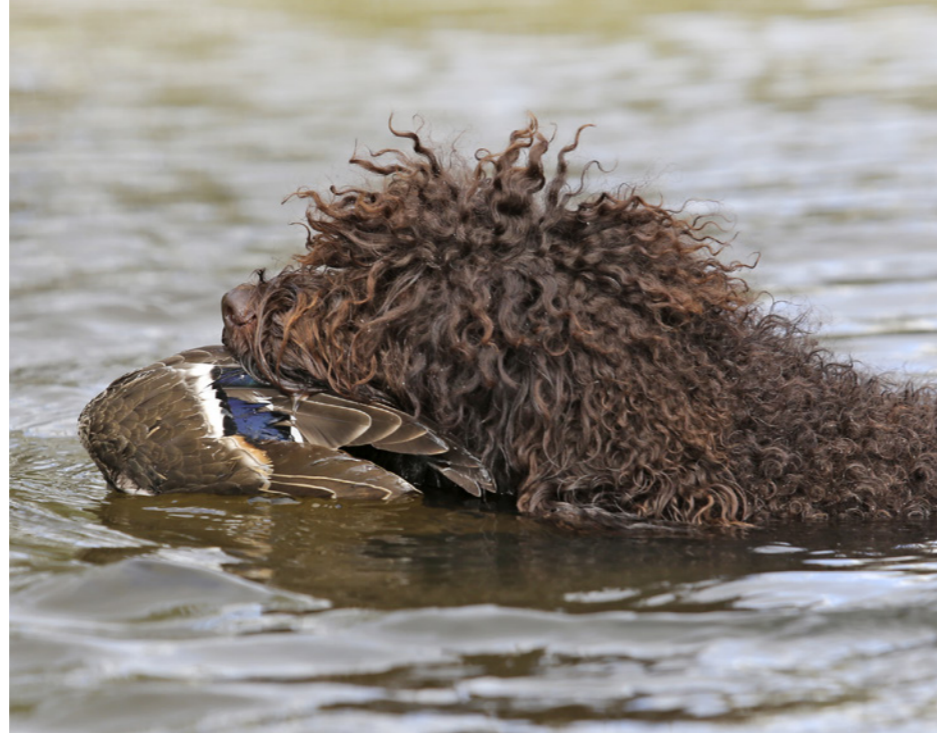
Barbeten er skabt til vandarbejde. Den bekymrer sig ikke om kulde og går i vand på alle tider af året.