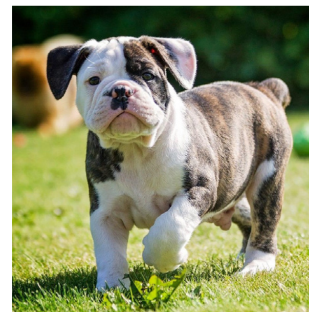
Nutidens old english bulldog er en rekonstruktion af den oprindelige bulldogge fra 1600- og 1700-tallet.

I 2020 besluttede Dansk Kennel Klubs bestyrelse efter moden overvejelse at optage racen old english bulldog i DKK's såkaldte X-register. DKK accepterer overførsel af hunde med stambøger fra en række andre stambogsførende organisationer, men behandler hver enkelt sag om overførsel som enkeltstående dispensationssager, hvilket også er tilfældet for old english bulldog. Dansk Kennel Klub anerkender og registrerer enkelte racer, der ikke er anerkendt af vores hovedorganisation, FCI, f.eks. en af vores nationalracer, dansk spids, som endnu ikke er internationalt anerkendt. Til det formål har DKK oprettet et såkaldt X-register, der kan betegnes som et parallelt registreringssystem til det, DKK benytter til FCI- anerkendte racer. Den enkelte hund får udstedt en DKK-stambog, der dog ikke kan anerkendes af FCI, og som derfor ikke kan benyttes til FCI- anerkendt avl. Afkom kan derfor kun stambogsføres i DKK's X-register. Hunden får udstillingsret på Dansk Kennel Klubs udstillinger (dog kan de ikke gå videre til konkurrencen om bedst i gruppen og kan ikke modtage det internationale certifikat, CACIB), men når en race er godkendt til registrering i X-register, gælder beslutningen for alle de nordiske lande. Det giver derfor mulighed for, at man i disse lande kan konkurrere i forskellige hundesportsgrene lydighed, rally-lydighed, agility, nose work og HTM/freestyle. >>>