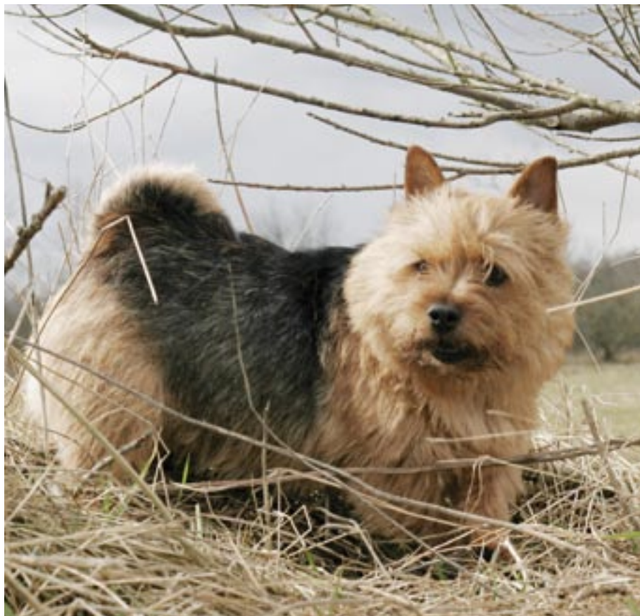
▲ Norwich terrieren er udstyret med en stor nysgerrighed. Alt skal undersøges, og selvtilliden er i top både i forhold til nye ting, steder og mennesker.

dandie dinmont, bedlington, cairn, abberdeen (forgængeren for skotten) og staffordshire bull terrier. Det siges også, at der på et tidspunkt blev blandet en enkelt gravhund ind.