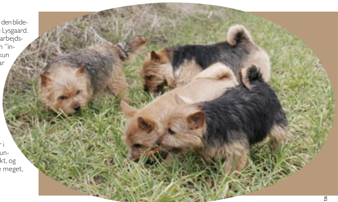
▲ Norwich terrierens oprindelse som jagthund af bl.a. mus og rotter fornægter sig ikke. Næsen bruges ivrigt – måske kan noget opstøves...

- Norwich terrieren vil ikke bare have dit mentale nærvær; den holder også uendelig