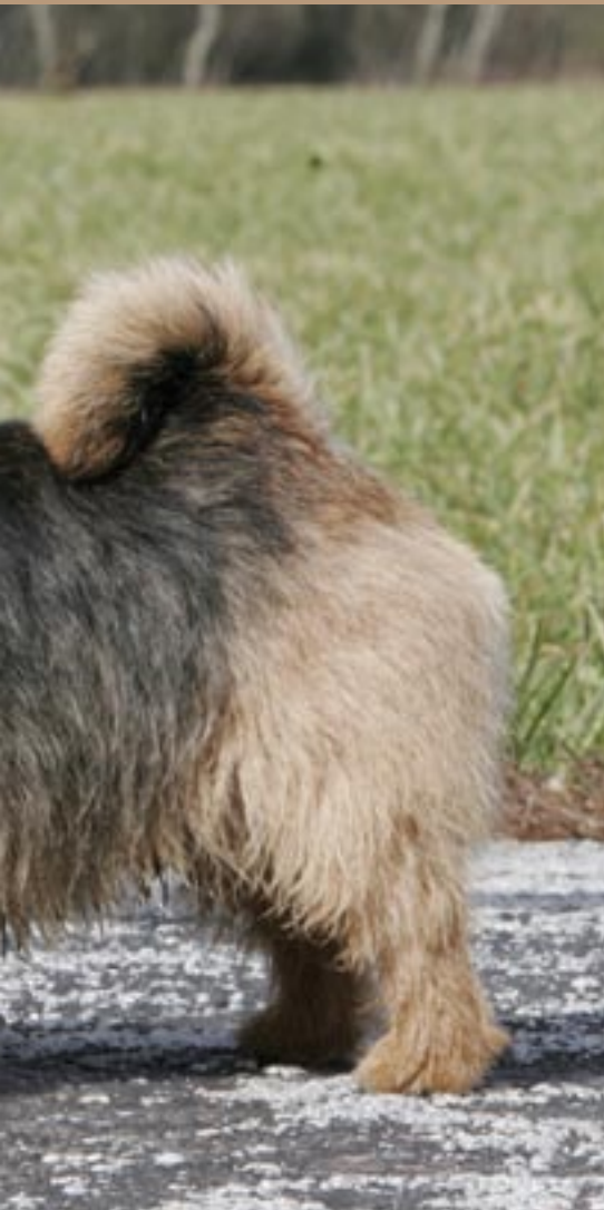
▲ Norwich terrieren skal trimmes 3-4 gange årligt. Til gengæld kræver den kun et minimum af pelspleje i dagligdagen.