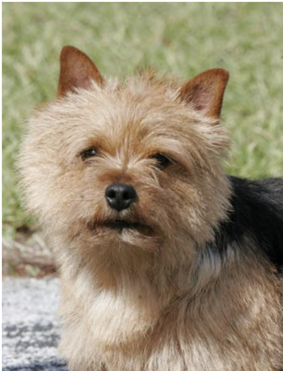
▲ Norwich terrieren findes i black and tan – som denne hund – samt i grizzle (rød/sort-meleret) og i mange afskygninger af rød.

meget af fysisk kontakt. Hvis man vælger at have racen, skal man derfor kunne lide at have en hund omkring sig hele tiden. En norwich terrier vil give hvad som helst for at komme på skødet af dig! Norwichen er en hund, der kræver dig; du skal være til stede for den. Lever du op til det, har du en glad, glad, glad hund, fastslår Anette Lysgaard.