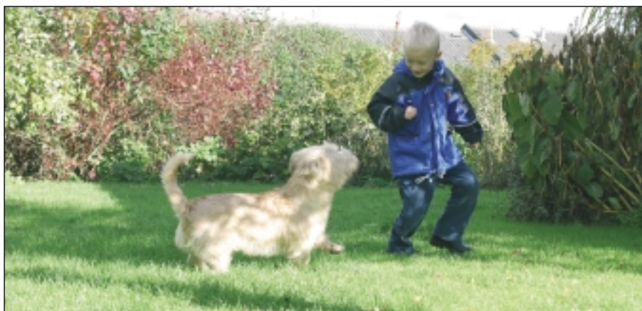
At lege med børn er en kærkommen beskæftigelse for en irish glen of imaal terrier.

- Der verserer også historier om, at glennen har været anvendt til hundekampe i gamle dage. At de fattige bønder har gjort det er ikke utænkeligt. Deres liv har været hårdt i den lidt golde dal, og de har skulle skrabe alt det til sig, de havde mulighed for – måske også præmier fra hundekampe. Om glennen har været