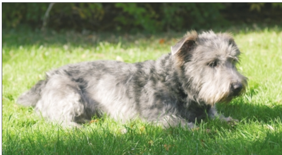
Den er rolig, irish glen of imaal terrieren. Når dens nysgerrighed er stillet, lægger den sig gerne for sig selv og betragter verden.