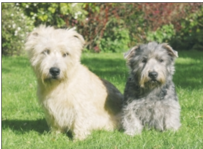
Irish glen of imaal terrieren findes i to farver: hvedefarvet og blåbrindlet.

- En anden ting, de fleste glenner holder meget af, er at svømme. Det hænger måske også sammen med deres historie. I gamle dage havde man udover Major Trial, som hundene jo skulle bestå for at blive udstillingschampions, Minor Trial, som blev brugt i konkurrencer. I disse konkurrencer skulle hundene blandt andet fange kaniner og gå i vand efter rotter. ■