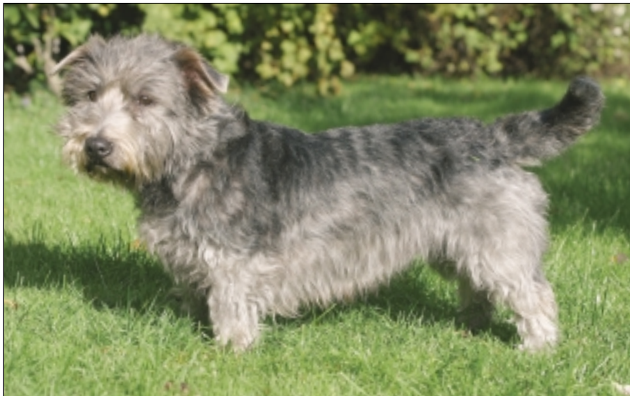
Der findes kun omkring 200 irish glen of imaal terriere i Danmark. På verdensplan taler vi om få tusinde.

glen, og det er den faktisk god til. Her kommer dens rolige og velovervejede gemyt rigtigt til udtryk. Agility er også en mulighed. Mange glenner synes, det er sjovt, men det er klart, at man ikke laver en super agility-konkurrencehund af denne race. Dertil er den for egensindig og fysisk tung. Men set i forhold til den robuste kropsbygning er den faktisk imponerende hurtigt.