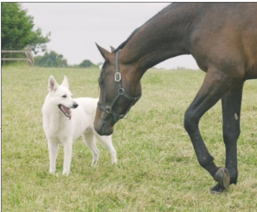
Den hvide schweiziske hyrdehund går fint i spænd med andre dyr.

og man skal regne med, at de kræver deres daglige gåture.