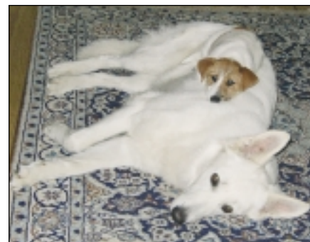
Den hvide schweiziske hyrdehund er meget venlig overfor andre hunde. Her har den lille jack russell terrier fundet en sand kammerat!

- Vi står i øjeblikket med en utrolig sund race, og der arbejdes hele tiden på at bevare og styrke racens sundhed. Vi er meget obs på, hvad der foregår avlsmæssigt rundt omkring - også i udlandet, for at sikre os nyt blod i hundene. Heldigvis