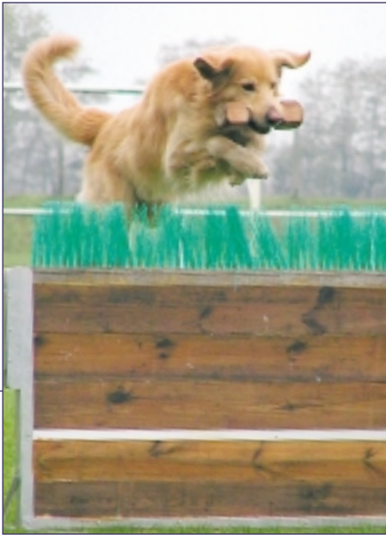
Forstår man at motivere hovawarten, har man en ivrig og arbejdsglad hund.