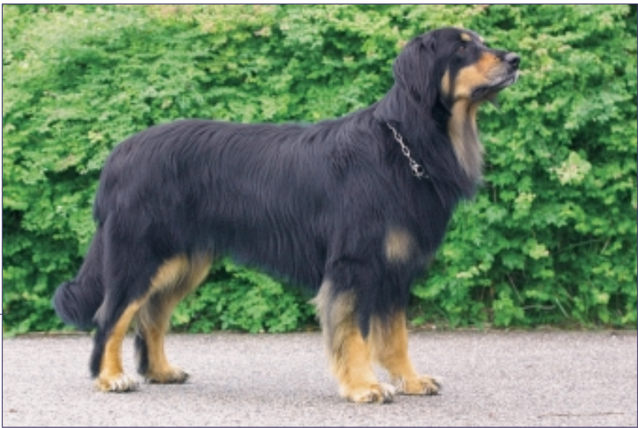
I Danmark er schwarzmarken (sort med blonde aftegn) hovawartens mest almindelige farve. Desuden findes den i blond (som ikke må være helt ensfarvet men skal changere) og helt sort.

brugshund. Den skulle vise arbejdsvilje og iver, gøre alt for sin hundefører, være lærenem og ikke alt for selvstændig, den skal have byttedrift, legelyst og en god næse. Disse egenskaber fik man også frem, omend der stadig kan spores nogle egenskaber fra de gamle gårdhunde såsom selvstændigheden i hovawarten.