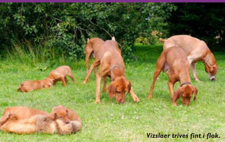
Vizslaer trives fint i flok.

”En vizsla, som er sundt og naturligt aktiveret og får sine behov dækket, er utrolig nem at have.”