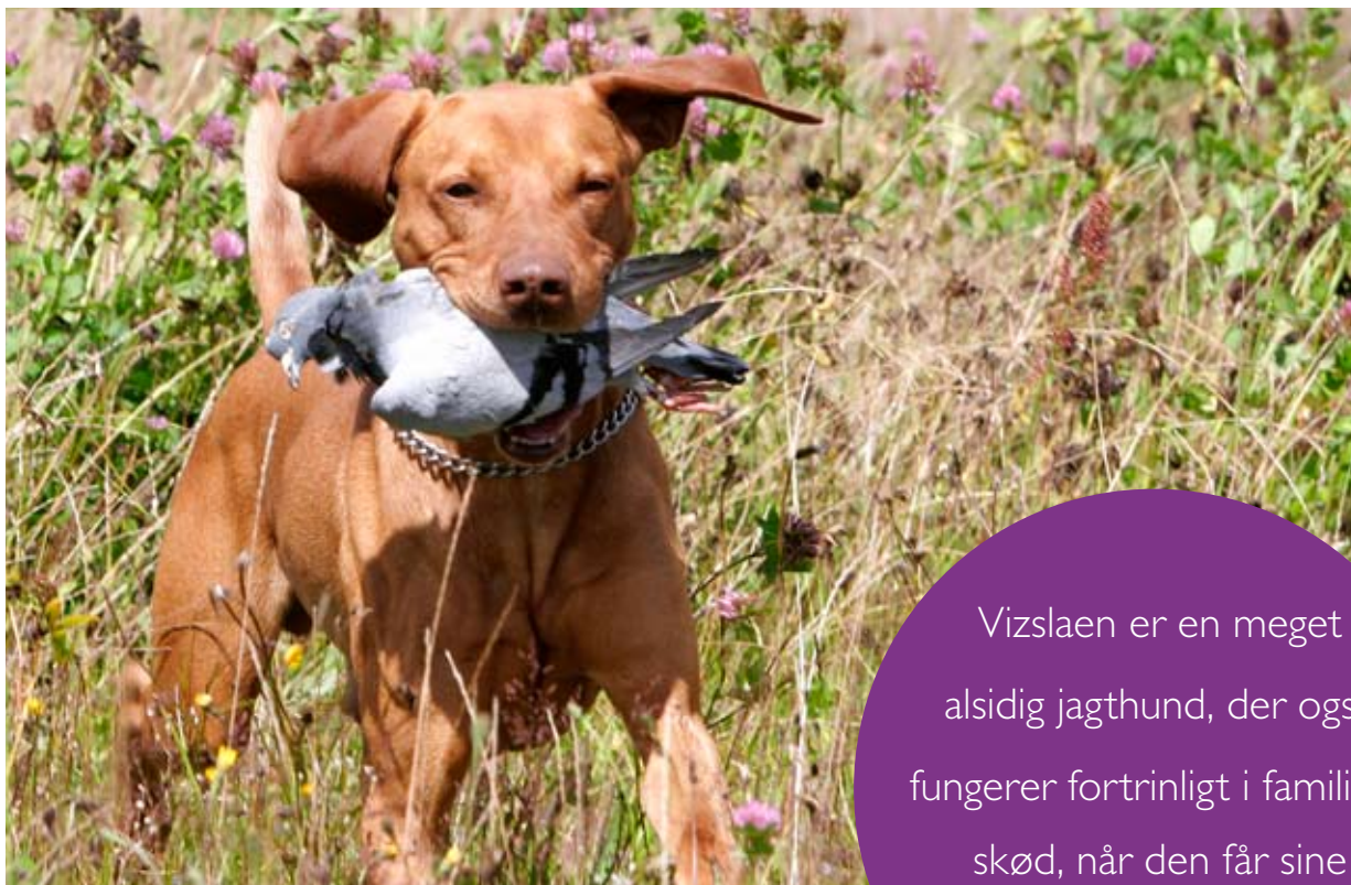
Vizslaen er en glimrende apportør – egenskaben ligger dybt i dens gener.

Vizslaen er en meget alsidig jagthund, der også fungerer fortrinligt i familiens skød, når den får sine aktivitetsmæssige behov opfyldt