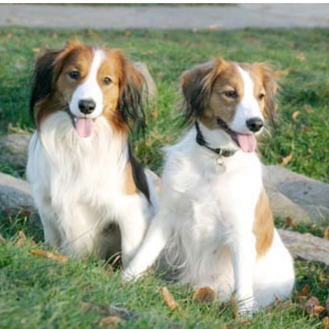
Kooikeren tilhører FCI gruppe 8 og er en ”stødende jagthund”, skabt til at lokke ænder i specialbyggede fælder i tæt samarbejde med fuglefængerne. I hjemmet er den rolig og tilpasningsdygtig.

- Til gengæld er den en herlig arbejds-hund, som holder rigtig god kontakt og kan bruges til stort set alle former for træning, fortsætter Torben. - Den er meget social og vil opholde sig, hvor du er – du behøver aldrig se dig omkring efter hunden, men skal nærmere passe på ikke at komme til at træde på den!