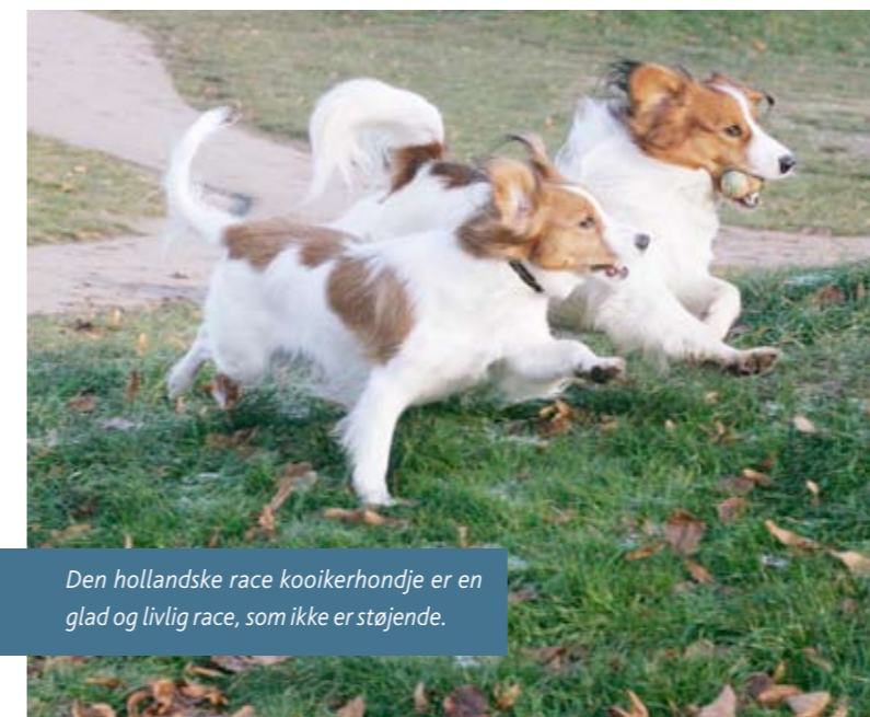
Den hollandske race kooikerhondje er en glad og livlig race, som ikke er støjende.