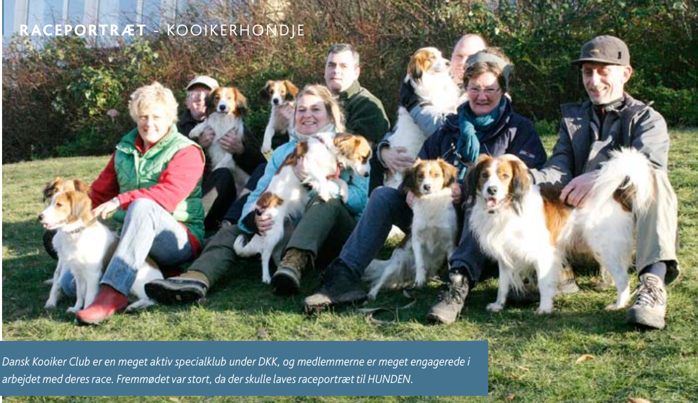
Dansk Kooiker Club er en meget aktiv specialklub under DKK, og medlemmerne er meget engagerede i arbejdet med deres race. Fremmødet var stort, da der skulle laves raceportræt til HUNDEN.

”kooiker-dage”, busture til Holland og andre aktiviteter, men vi er også rigtig gode til at samarbejde om avlsarbejdet mht. hundenes sundhed. For selvom kooikeren generelt er en meget sund race, så skader det ikke at være på forkant med udviklingen, så ikke vi pludselig står med f.eks. et alvorligt HD-problem i racen. For os er ordene oplysning, åbenhed og samarbejde helt centrale, forklarer Torben Nielsen og nævner udstillingerne