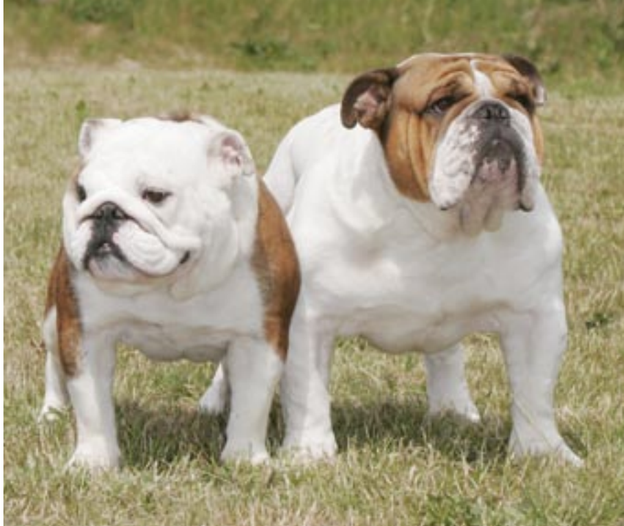
Der er stor forskel på den engelske bulldog kønnene imellem. En voksen han vejer omkring 25 kg – en tæve ca. 23 kg. Skulle nogen være i tvivl, er det en hanhund til højre...

- Det, bulldoggen skal opdrages og trænes til, skal gentages mange gange – men på en