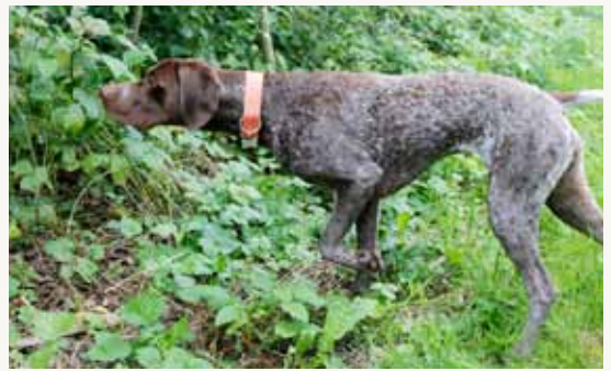
En meget opmærksom braque har taget stand og venter på, at jægeren er klar til at skyde.

Generelt er braque francais type pyrenees let at føre, og træningen giver sjældent de store problemer