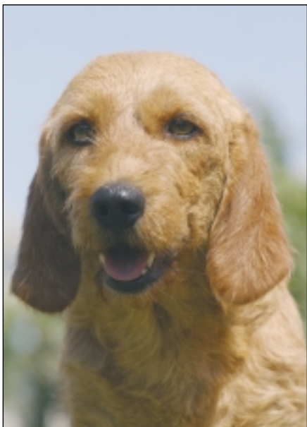
Basset fauve de bretagne er ikke en særlig kendt race i Danmark. Vi har omkring 300 eksemplarer i landet.

en fantastisk adræt hund, som let bevæger sig i vanskeligt terræn, og eftersom den ikke er særlig stor, kan den komme ind mange steder, de større hunde, som ellers bruges til eftersøgninger, ikke har mulighed for. Et meget skægt eksempel på racens adræthed har jeg fra en af mine hvalpekøbere, hvis hund kan kravle rundt i stynede træer. Jeg vil faktisk sammenligne racens adræthed med en katts. Hurtigheden har den også.