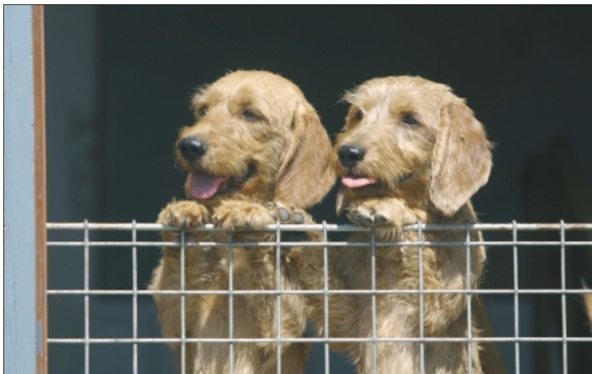
Er man af racen basset fauve de bretagne, er man nysgerrig og følger gerne med i, hvad der foregår.