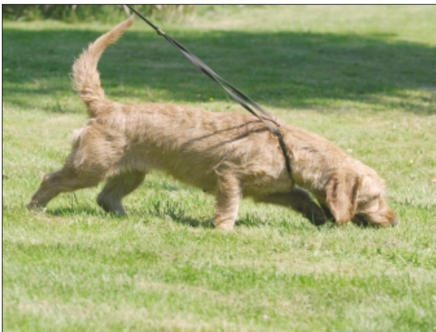
Næsen hos basset fauve de bretagne er formidabel – og den anvendes ivrigt.