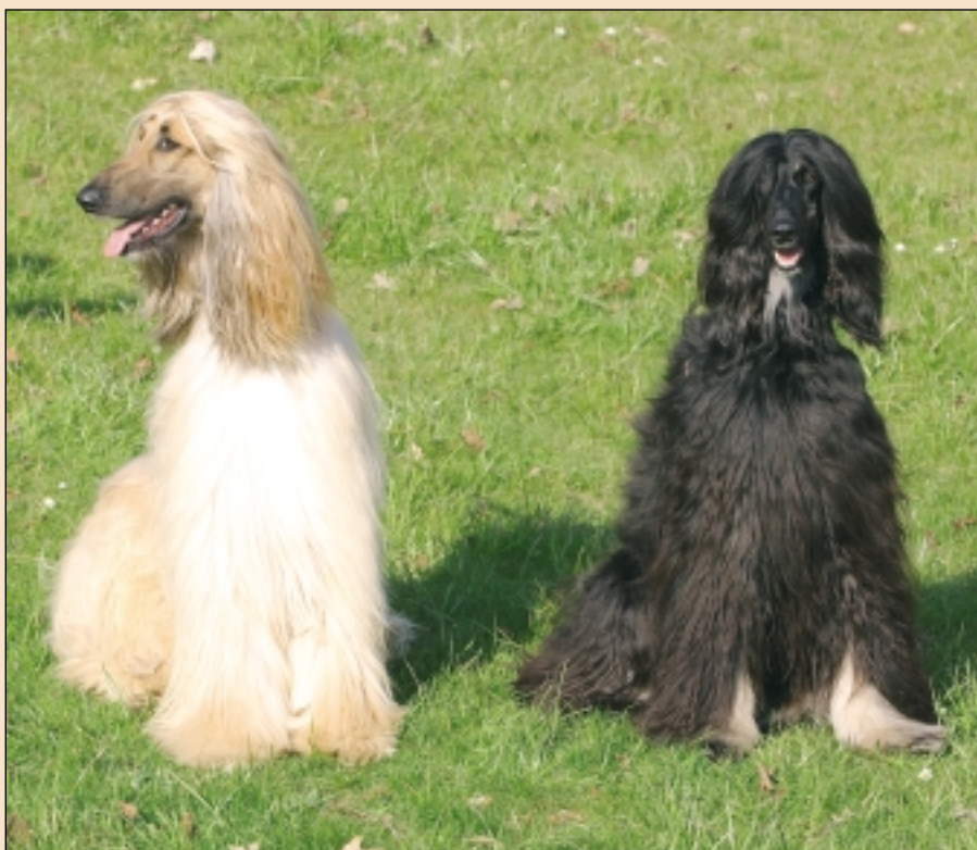
Alle farver er tilladte hos den afghanske mynde. Her ses en black and brindle og en gylden.