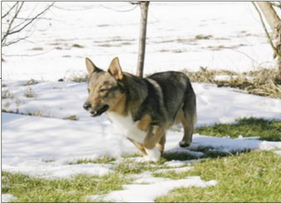
Västgötaspidsen er ikke vanvittig motionskrævende, men den sætter pris på at komme ud uden snoren.

hunde årligt. Norge og Finland har også mange västgötaspids, og Holland og Belgien har mindre populationer. Herhjemme findes der ikke så mange – der fødes blot nogle ganske få kuld om året. Hidtil har racens udvikling altså været ret beskeden, men det tror jeg er ved at ændre sig, for som racerepræsentant får jeg efterhånden en del opkald fra mennesker, der er interesserede i racen.