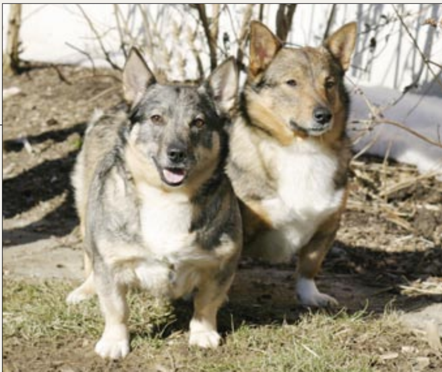
Rødbrun og stålgrå, som ses på billedet, er de meste udbredte farver hos västgötaspidsen, men den findes også i gråbrun. Hvide pletter fordelt på kroppen er tilladt – de må dog højst fylde 30% af hunden.