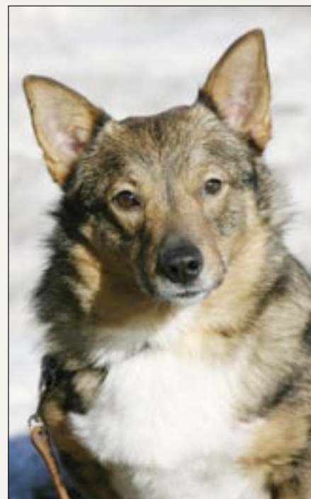
Bestanden af västgötaspidser er begrænset i Danmark. Her fødes kun få kuld årligt.

er en opgave, den stadig er meget dygtig til at løse. Hører min tæve, at der er en muldvarp i aktivitet, venter hun tålmodigt, indtil den sætter snuden for langt frem – så sidder den i saksen. Og kommer der en rotte på den forkerte side af hækken, er det helt sikkert, at den dør.