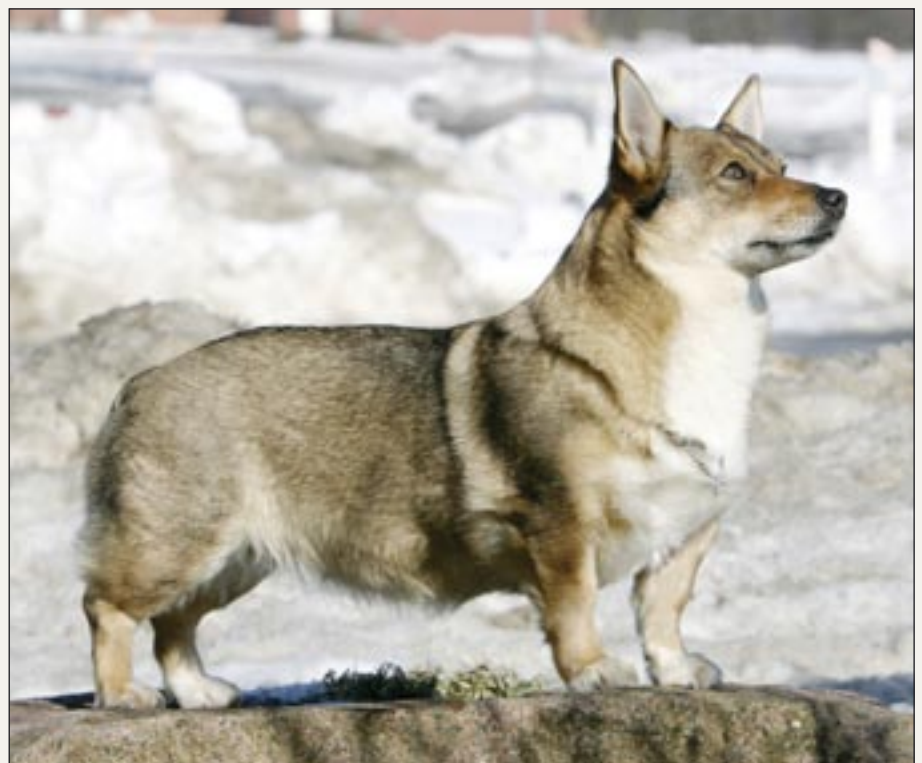
Der er kun en begrænset mængde pelspleje forbundet med västgötaspidsen, som fældes et par gange årligt. Den skal bare børstes lidt – klipping er der intet af.

- Som sagt har västgötaspidsen også haft til opgave at holde gnavere i skak, og det ➡