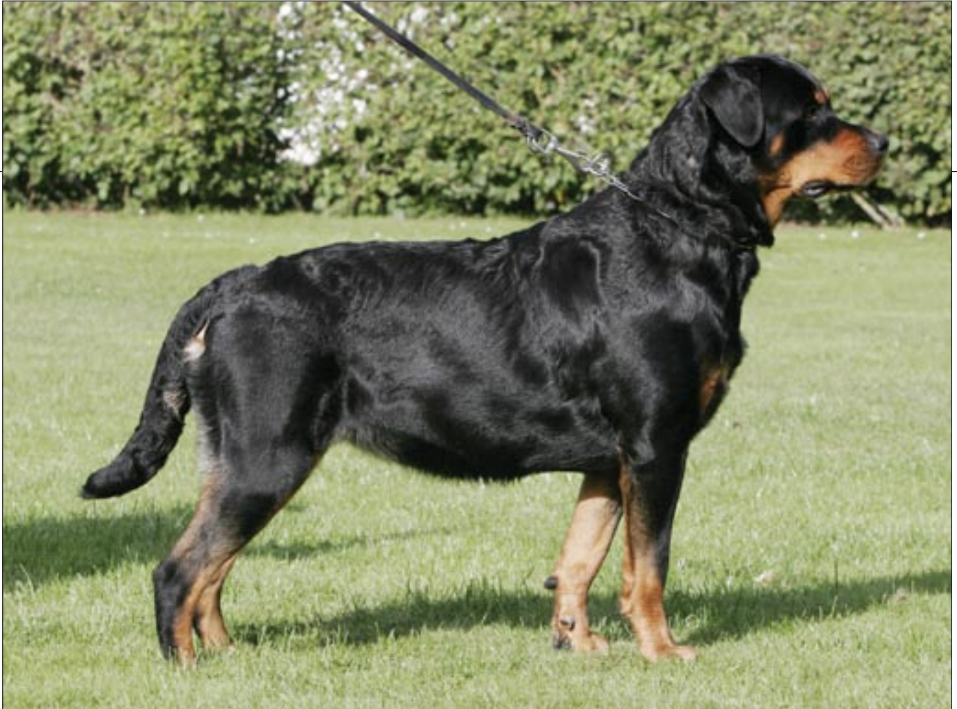
Rottweileren er en robust og stærk hund.

en dårlig dag, udfører den ikke øvelserne optimalt.