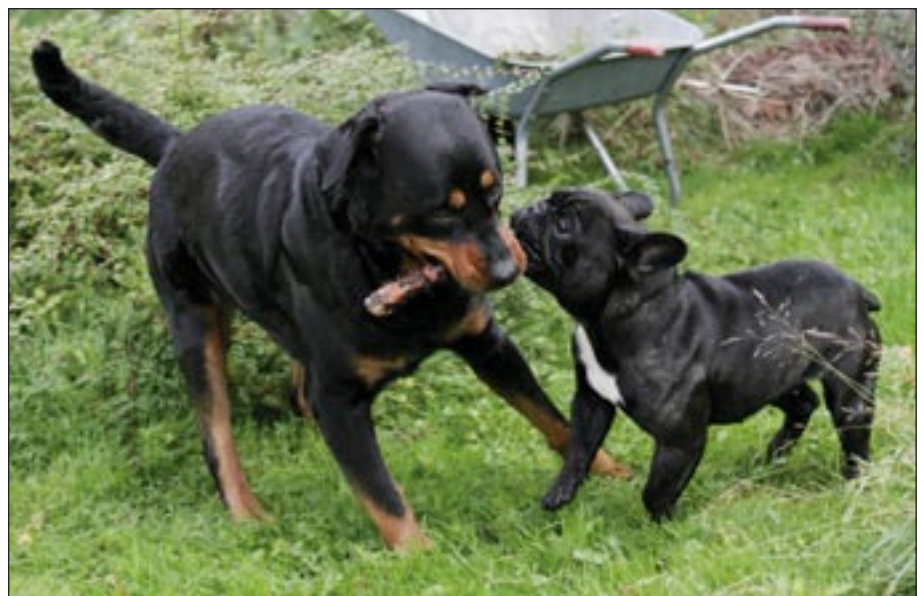
Rottweileren elsker typisk små dyr af enhver slags og passer godt på dem. Hvis der opstår problemer, vil det nærmere være med artsfæller på grund af den dominans, der – især hos hannerne – ligger til racen. De slås ikke ofte, men når det sker, kan det godt gå hårdt for sig.

- Især hannerne vil gerne prøve kræfter og ind imellem protestere imod tingene livet igennem, så du skal sørge for at være kontant i dine udmeldinger. Det er en hund med modstand; den har en vis portion stædighed og viljestyrke, men det er jo netop derfor, det er så sjovt og spændende at have den. Jeg vil ikke anbefale første-gangshundeejere at købe en ☹