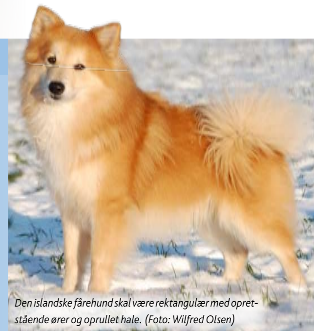
Den islandske fårehund skal være rektangulær med opretstående ører og oprullet hale.

Mange farver er tilladt (én bør altid være dominerende): forskellige nuancer af tan (varierende fra cremefarvet til rødbrun), chokoladebrun, grå og sort – alle med hvide aftegninger.