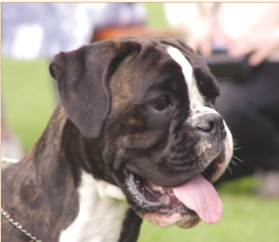
Boxeren har et meget karakteristisk hoved.

familien, og derfor var man helt fra begyndelsen bevidst om at importere de mindre skarpe boxere. Det har naturligvis haft stor betydning for, at vi i dag har en meget venlig og glad familiehund i boxeren.