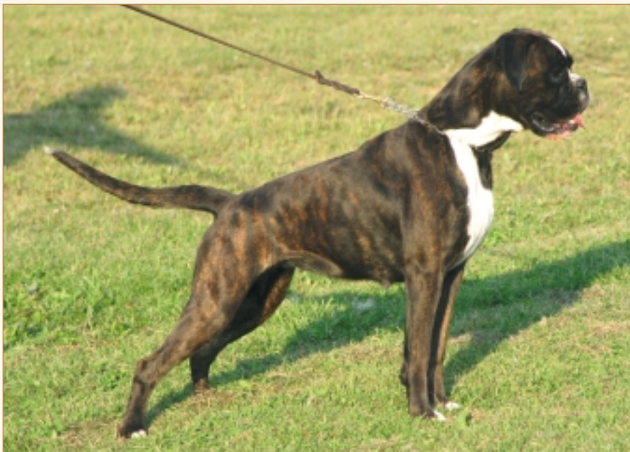
Der stambogsføres små 300 boxeren årligt i Danmark.