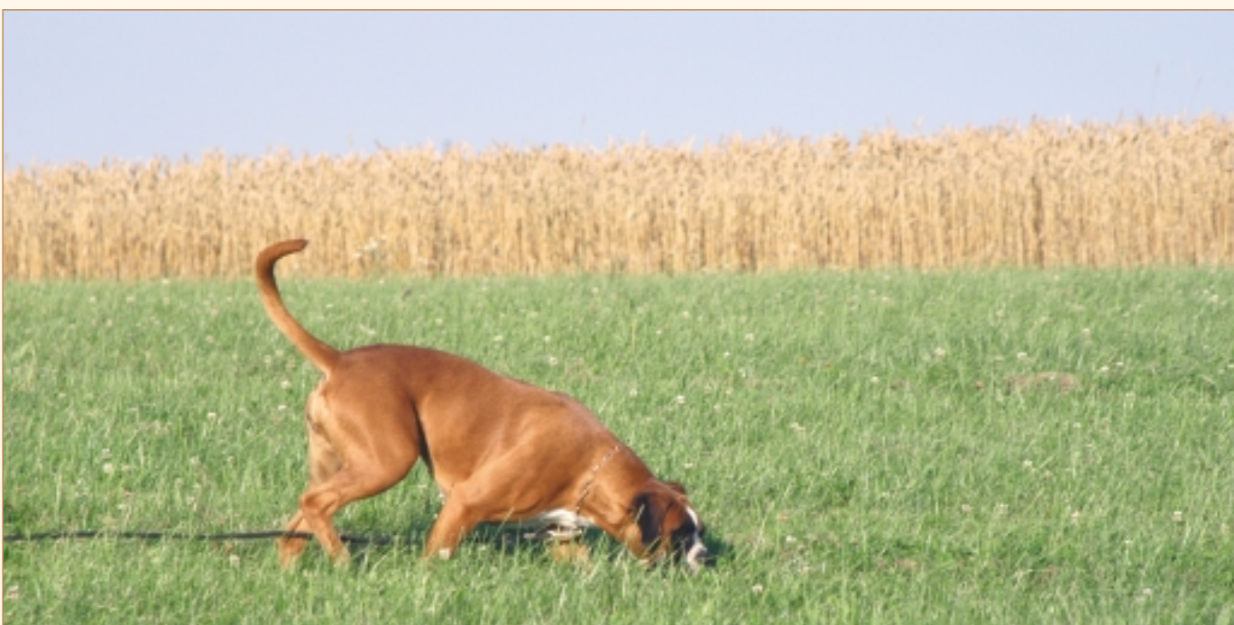
Boxeren er glimrende til at gå spor.

met til Danmark omkring 1930, og i 1932 blev Boxer-klubben stiftet. De tyske hunde, der blev anvendt som tjenestehunde, havde en vis skarphed som følge af den funktion, de var avlet til. I Danmark havde man typisk boxerne sammen med