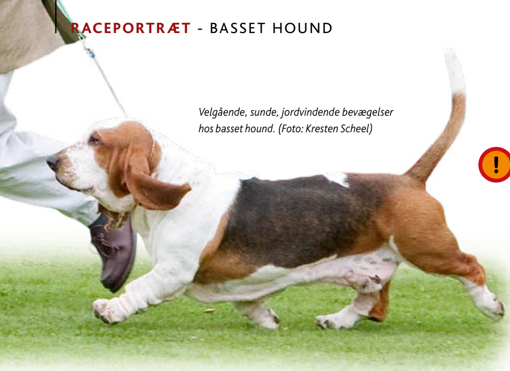
Velgående, sunde, jordvindende bevægelser hos basset hound.