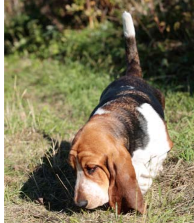
Næsen i jorden – et typisk basset-syn! (Foto: Wiegaarden/Stine Melin)

Trods et muntert sind har basset hunden et lidt sørgmodigt udtryk, hvilket skyldes rynkerne og de hængende øjne. Man kan se den røde rand af nederste øjenlåg – dette må ifølge standarden ikke være overdrevent. (Foto: Wiegaarden/Stine Melin)